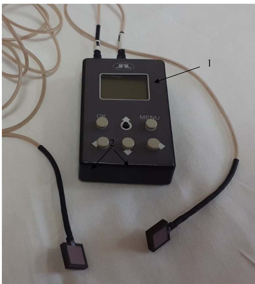
Рис. 1. Термоелектричний прилад для діагностики запальних процесів та больового синдрому при дегенеративно-дистрофічних захворюваннях попереково-крижового відділу хребта людини: 1 – блок керування, 2 – термоелектричний сенсор температури і теплового потоку