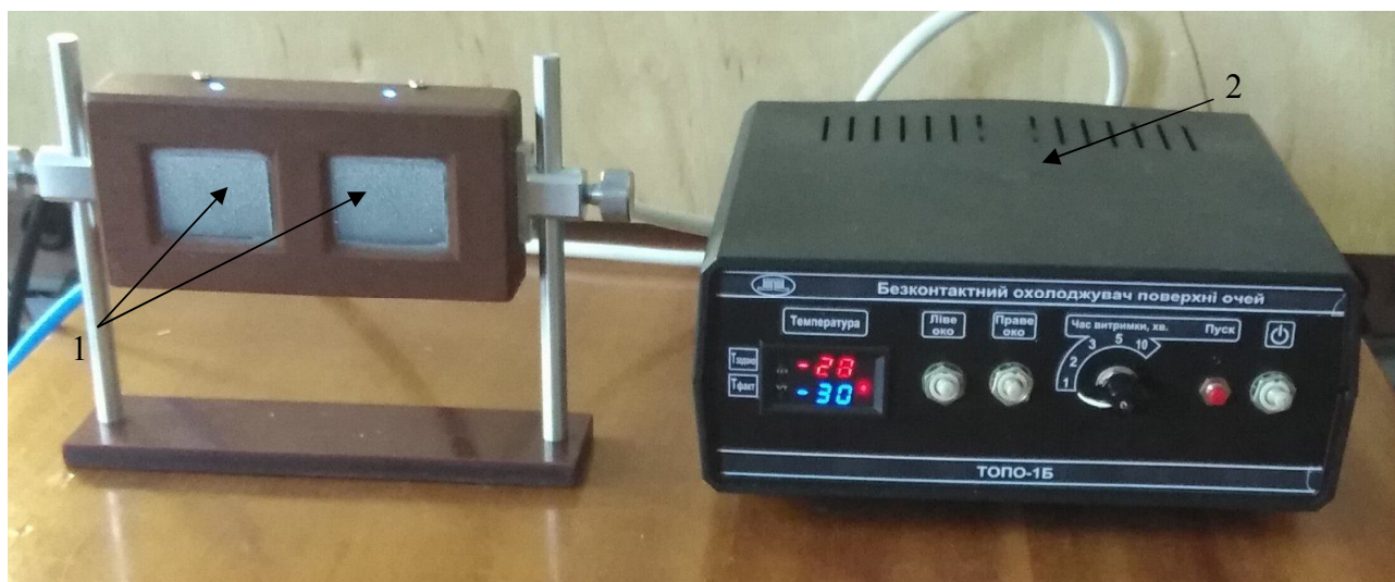
Рис. 1. Експериментальний зразок термоелектричного приладу для безконтактного охолодження очей людини: 1 – термоелектричні модулі охолодження (ТЕМО), 2 – електронний блок керування та живлення

Прилад призначений для лікування гострих і хронічних захворювань ока, зниження внутрішньоочного тиску, зменшення больового синдрому та запальних процесів ока людини. Розроблений термоелектричний медичний прилад дає можливість локально безконтактно охолоджувати структури ока, що дозволить розробити та впровадити технологію безконтактної контрольованої локальної терапевтичної гіпотермії в офтальмології [8, 14 – 20]. Такий прилад є оригінальним та не має світових аналогів.