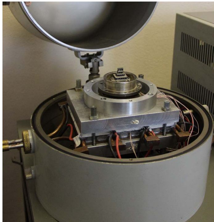
Рис. 2. Зовнішній вигляд термоелектричного модуля охолодження детектора рентгенівського випромінювання

Для проведення експериментальних досліджень термоелектричного багатокаскадного охолоджувача рентгенівських детекторів розроблено спеціальний вимірювальний стенд для максимального відтворення режимів його експлуатації (рис. 2).