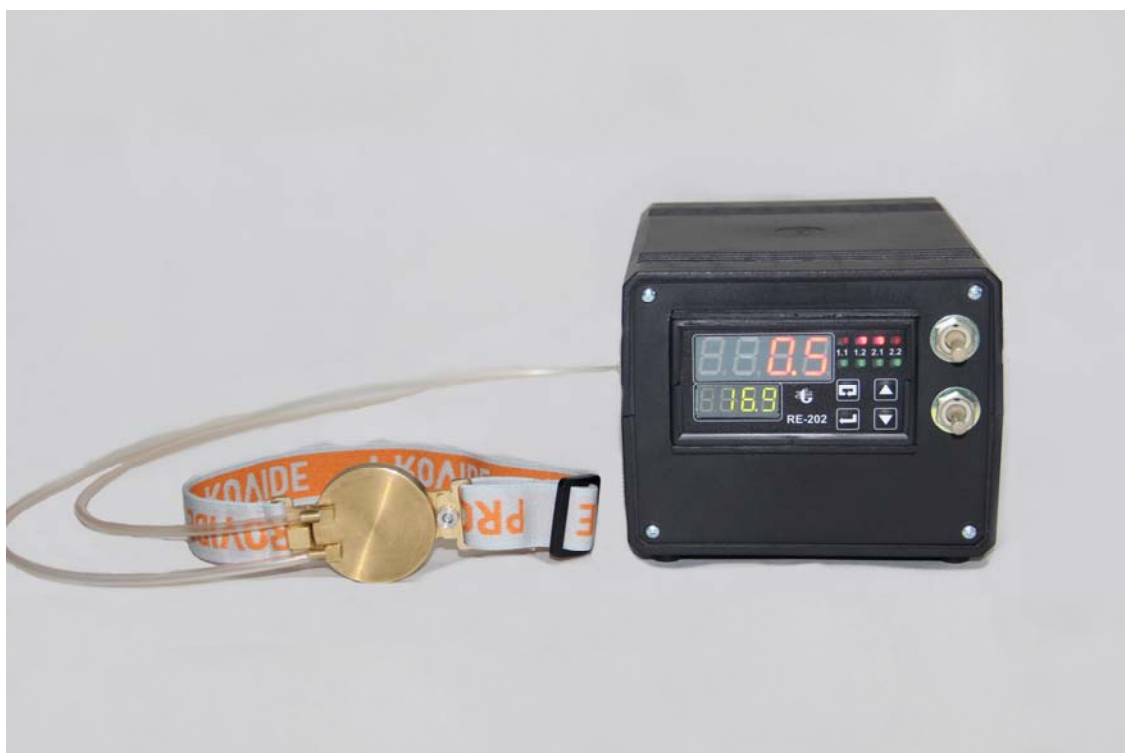
Рис. 1. Експериментальний зразок термоелектричного приладу у вигляді монокулярної пов'язки для контактного охолодження ока людини через повіки: 1 – охолоджуюча пластина, 2 – термоелектричний електронний блок охолодження, керування та живлення

Прилад призначений для лікування гострих і хронічних захворювань ока, зниження внутрішньоочного тиску, зменшення больового синдрому та запальних процесів ока людини. Розроблений термоелектричний медичний прилад дає можливість контрольованого локального контактного охолодження структур ока через повіки та дозволяє розробити і впровадити технологію контрольованої локальної терапевтичної гіпотермії в офтальмології. Такий прилад є оригінальним та не має світових аналогів.